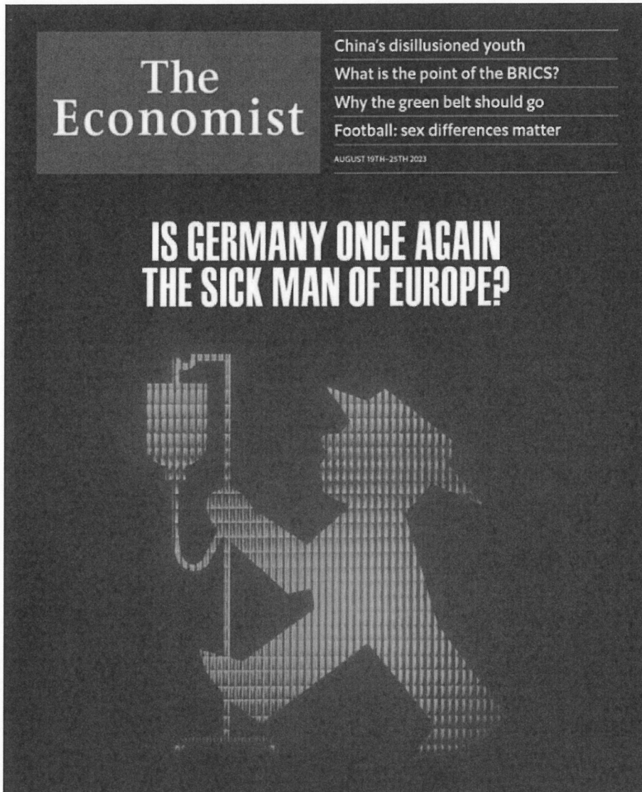
The Economist, Aug 2023 (Ist Deutschland mal wieder der kranke Mann Europas?)