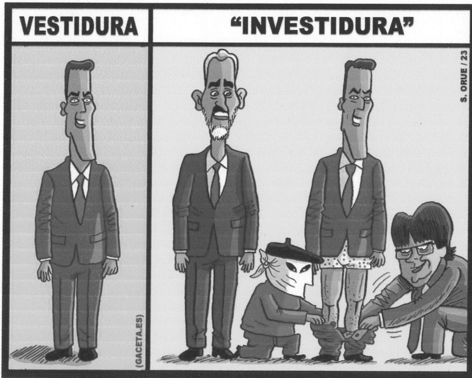
La Viñeta de la Iberosfera. La Gaceta , 22 de agosto de 2023