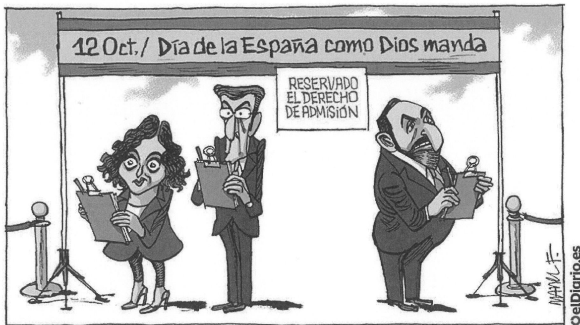
La Comunidad de Madrid celebrando el Día de la Hispanidad. El Diario , 12 de octubre de 2023